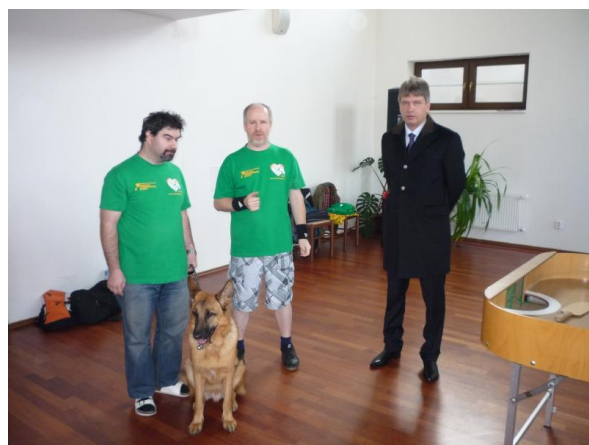
Brno Show 2010