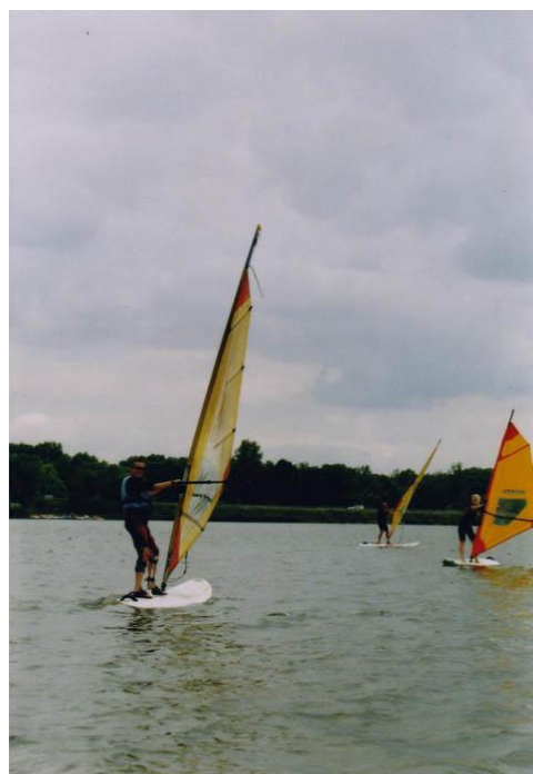
Windsurfing na Novomlýnských nádržích.